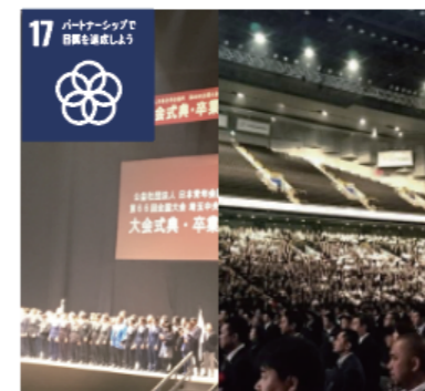
全国のJCメンバー15000人が集う全国大会を我々の手で開催しました。

SDGs (Sustainable Development Goals) とは? 2015年に国連で定められた指針で、“誰一人取り残さない”持続可能で多様性と包摂性のある社会の実現のため、2030年を目指して17の国際目標が定められました。