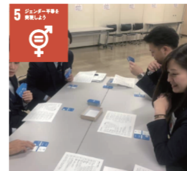
女性も活動しやすい環境を作り、ジェンダー平等に取り組んでいます。