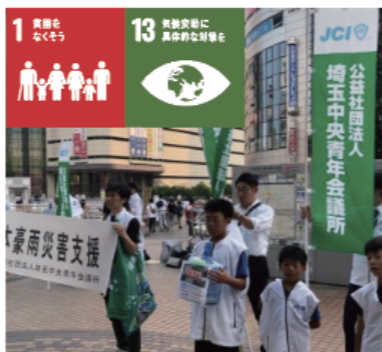
災害の際はメンバーで大宮駅にて募金活動を行いました。