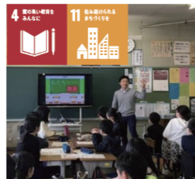
小・中学生に選挙の大事さを教える主権者教育を提供しています。