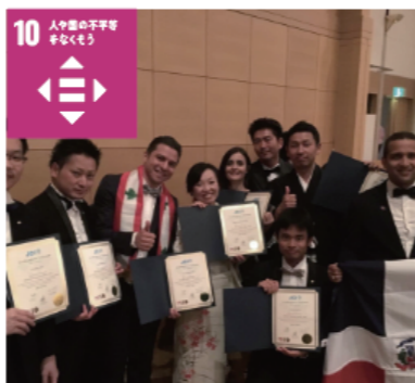
世界各国の代表が集まり研修を行うプログラムもあります。